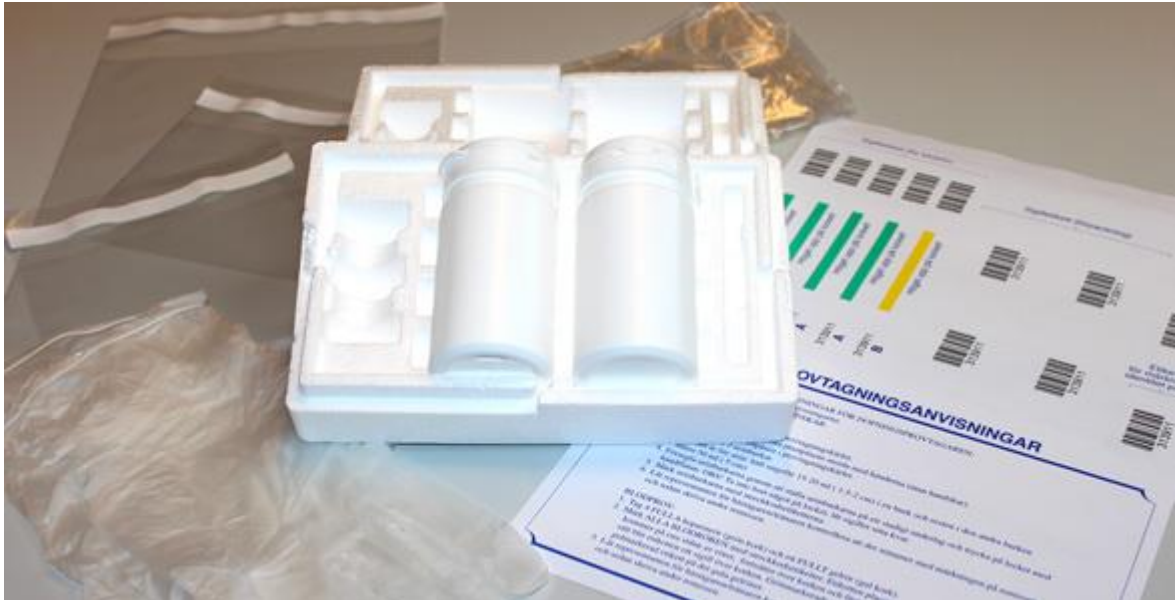
Prøvetakingssett for urin.

Urin skal være spontant avgitt og samlet i en håv eller prøvetakingskar med en ren plastpose.