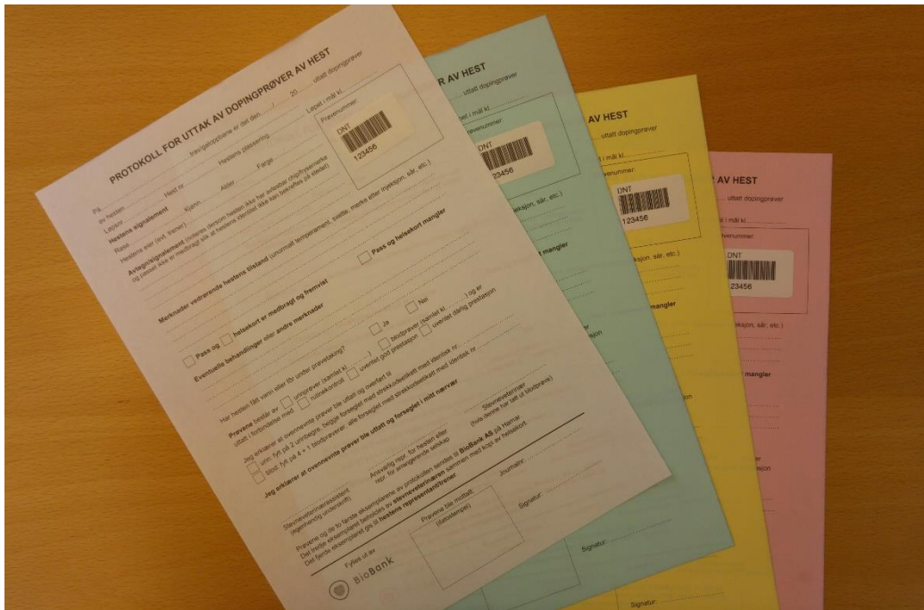
Protokoll for uttak av dopingprøver av hest.

15. Protokoll for uttak av dopingprøver av hest er utarbeidet av Det Norske Travselskap i samarbeid med BioBank.